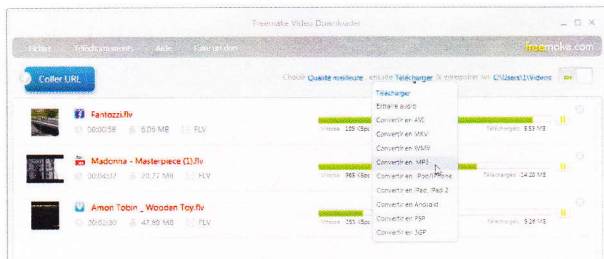
Freemake Video Downloader