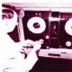
Sauvegarde en ligne : Risc jette son