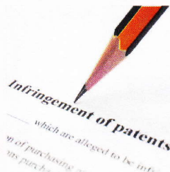
Brevets : Apple jette son dévolu sur le