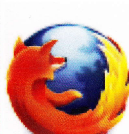
Mozilla Firefox ESR