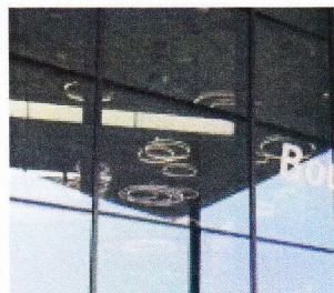
Bouygues Telecom pousse sa Bbox Pro à 200 mégabits